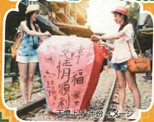
天燈上げ十分イメージ