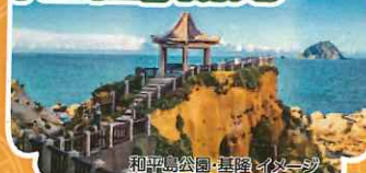
和平公園・基隆イメージ