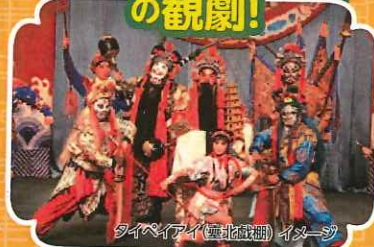
タイペイアイ(臺北戯園)イメージ