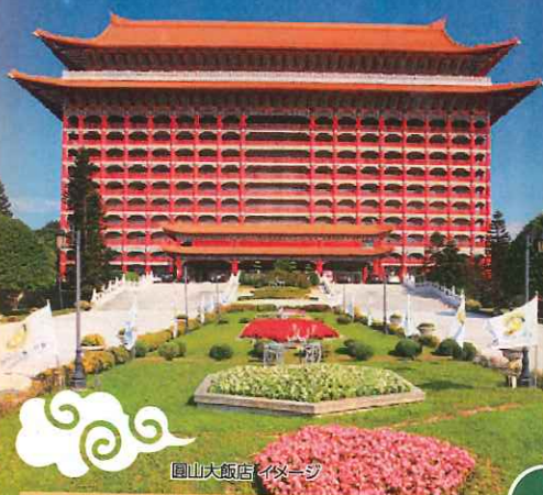
圓山大飯店イメージ

エバー航空(エコノミークラス)利用 小松空港から、みんなで行こう! 台北 4日間 ツイン2名1室利用/おとな・子ども同額 ※燃油サーチャージ・航空保険料(目安19,200円)、現地空港税・航空券システム手数料等(目安7,320円)の費用が別途必要になります。