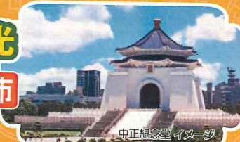
中正紀念堂イメージ