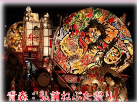
青森：弘前ねぶた祭り