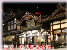
愛媛：道後温泉本館